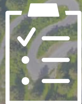
VOR ORT KONTROLLE